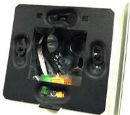
Рис. 2 Монтажная панель 3X3"