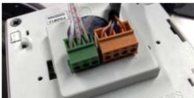
Рис 4 К DDP подключен S-BUS (Оранжевый) и IR Eye (Зеленый)

Как и любое другое устройство DDP должна быть подключена к сети S-BUS. Это делается с помощью коннектора 4D (см. в инструкцию по подключению S-BUS)