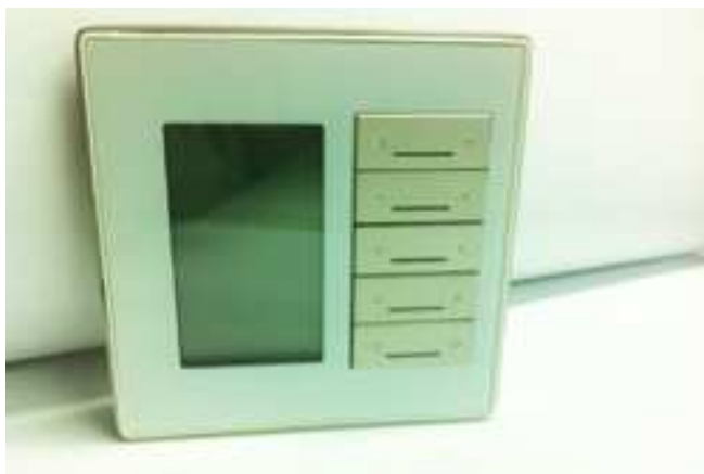
Рис. 1 DDP