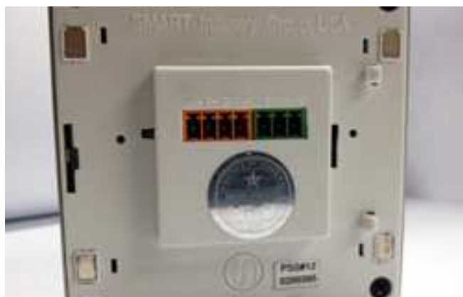
Рис. 3 Тильная сторона DDP

DDP имеет дополнительное небольшое устройство – ИК-приемник (IR eye), это устройство не является обязательным, и может быть подключено к DDP для приема ИК-команд с пульта ДУ «Smart Remote».