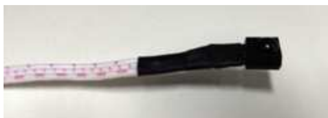
Рис. 6 ИК-приемник